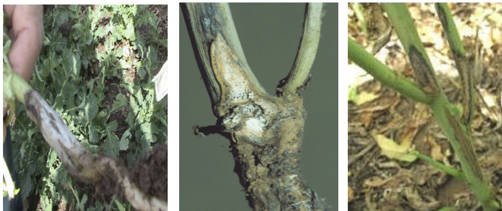
تصویر ۲- علائم سیاه شدن و شانکر طوقه و ساقه

همچنین علائم بیماری ممکن است بصورت لکه هائی در ساقه، بصورت شانکر مشاهده شود که خسارتزاترین حالت بیماری است. اندازه شانکر ممکن است بتدریج افزایش یافته، پوست دور تا دور ساقه تخریب شده و گیاه در نزدیک سطح خاک شدیداً خسارت دیده و ورس نماید. حمله قارچ به گل آذین می تواند سبب سوختگی ( بلایت ) در گلها شود. غلافهایی که دارای زخم با پوشش قارچ باشند، تولید بذور آلوده می کنند. بذرها اغلب چروکیده هستند و ممکن است جوانه نزنند.