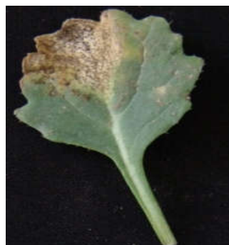
تصویر ۱- لکه های گرد همراه با نقاط سیاه رنگ روی برگ و کوتیلدون