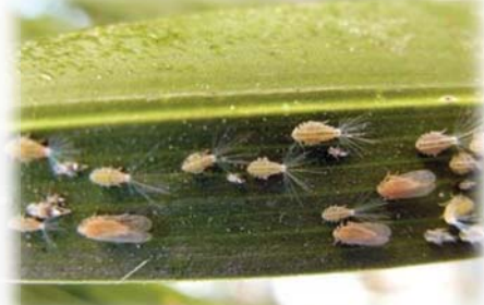
شکل ۵ - سنین مختلف پورگی زنجبرک خرما (سمت راست) و وجود رشته های مومی در انتهای شکم پوره (سمت چپ)