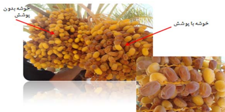
شکل ۶. تفاوت اندازه و کیفیت خوشه های خرما با پوشش توری پارچه ای و بدون پوشش

مهمترین مزایای کاربرد پوشش خوشه های خرما عبارتند از: بهبود خواص کمی و کیفی میوه خرما (شکل ۶)، جلوگیری از آلودگی خوشه ها به گرد و غبار، عسلک زنجبرک خرما و کاهش بازار پسندی میوه خرما، جلوگیری از آفتاب سوختگی، حفظ بهبود کیفیت و رنگ میوه. بهترین زمان نصب پوشش ها در مرحله تبدیل میوه خرما به خارک است (شکل ۷).