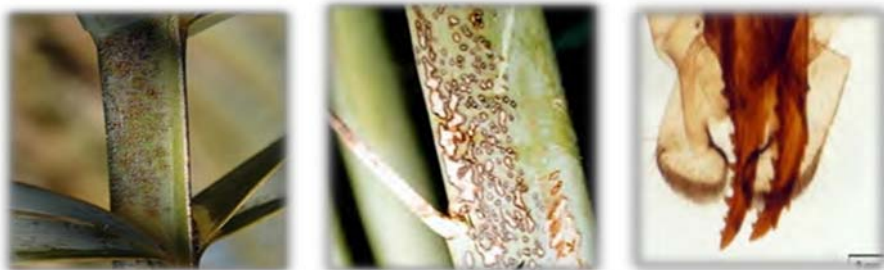
شکل ۲- تخم ریز حشره (تصویر سمت راست) و محل های تخمگذاری روی محور برگ (تصویر وسط و سمت چپ)

از نظر زیستگاه این آفت بخش های سایه دار و و سبز درخت را نسبت به بخش های خشک یا پوشیده شده از غبار ترجیح می دهد. معمولاً آلودگی های شدید در باغ های نزدیک به رودخانه ها، باغ های متراکم و فشرده یا باغ هایی با کشت مخلوط همراه با آبیاری زیاد و غرقابی، دیده می شود. هر دو پایه نخل ماده و نر در همه ارقام آلوده می شوند. این آفت هیچ گونه گرایشی به سمت نور ندارد. تخمگذاری معمولاً در شب های خنک انجام می شود. در این زمان حشره ماده، با وارد کردن تخم ریز خود در بافت های زنده و رگبرگ میانی برگچه ها، باعث قطع جریان شیره گیاهی، از بین رفتن بافت زنده درخت و سلول های گیاهی می شود. تعداد تخم به ازای هر حشره ماده به طور متوسط ۱۰۸ تخم برآورد شده است (شکل ۲).