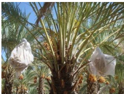
شکل ۷- نصب توری پارچه ای روی خوشه ها در ابتدای مرحله خارک