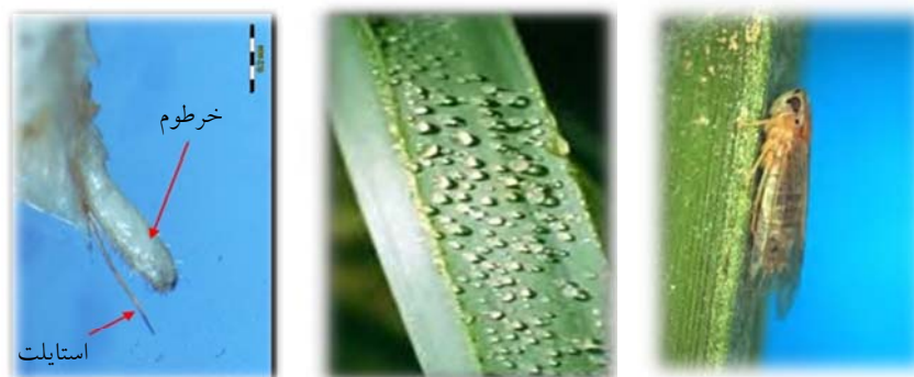
شکل ۱- حشره کامل (تصویر سمت راست)، ترشح عسلک (تصویر وسط) و قطعات دهانی زنجبرک از خرطوم کوچکی تشکیل شده که بوسیله آن شیره نباتی را می‌مکد (تصویر سمت چپ).

پوره‌ها و حشرات بالغ دارای خسارت مستقیم و غیر مستقیم هستند. خسارت مستقیم: ناشی از مکیدن شیره گیاهی توسط پوره‌ها و حشرات بالغ است و سبب زردی و خشکیدگی برگ‌ها و ضعف درخت خرما می‌شود. خسارت غیرمستقیم: ناشی از ترشح عسلک است که علاوه بر اینکه به عنوان یک منبع غذایی برای قارچ‌های ساپروفیت عمل می‌کند، سبب آغشته شدن میوه‌ها و کاهش بازار پسندی محصول می‌شود (شکل ۱).