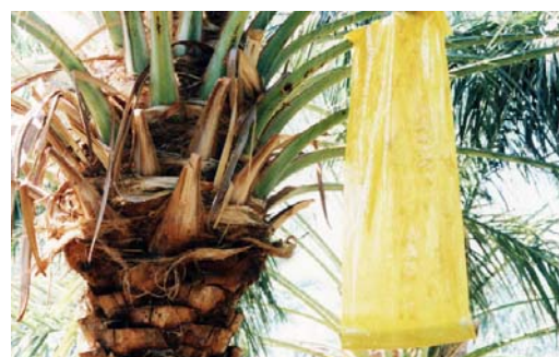
شکل ۸- پوره و حشرات کامل به تله افتاده در روی کارت زرد چسبنده