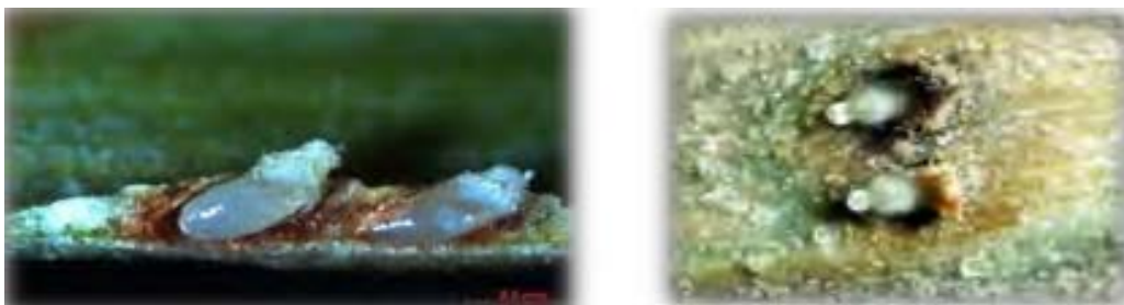
شکل ۴- تخم زنجبرک خرما

تخم های زنجبرک خرما، بیضی شکل بوده و طول آنها ۰/۸-۰/۵ میلی متر و عرض ۰/۱۳-۰/۱ میلی متر است. شکل ظاهری تخم در قسمت جلو کمی برآمده و در قسمت عقب آن باریک تر است. رنگ تخم ها در ابتدا سبز روشن و سپس زرد رنگ می شود (شکل ۴).