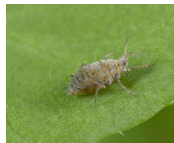
کلنی شته مومی روی برگ و گل کلزا به همراه شته مومی