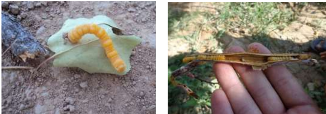
شکل ۴: لارو آفت سوسک شاخک بلند

لارو: به طور کلی لارو استوانه ای شکل، به رنگ زرد روشن و فاقد پا، دارای حلقه های برجسته است که چین خوردگی فراوان در سطح بدن وجود دارد. رنگ عمومی آنها زرد است. طول لارو در انتهای رشد تا ۳۲ میلی متر می رسد. این حشره دارای ۵ سن لاروی است (شکل ۴).