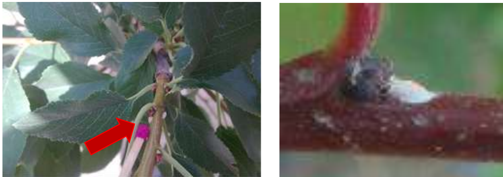
شکل ۳: تخم آفت سوسک شاخک بلند

تخم: تخم به طول ۲-۱/۸ میلی متر و به رنگ سفید متمایل به زرد است. قسمتی از تخم که روی بافت گیاه چسبیده، صاف و قسمت آزاد آن برجسته به شکل ته سنجاق می باشد (شکل ۳).