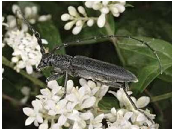
شکل ۷: جلب شدن حشره کامل به گل آذین سفید رنگ