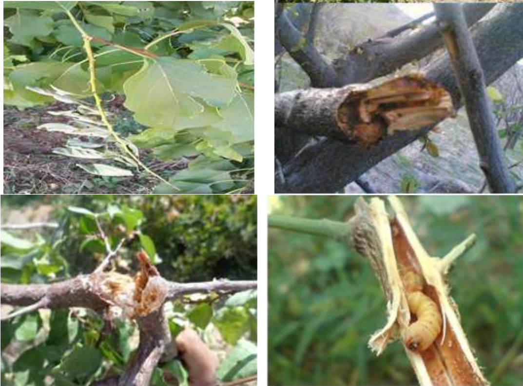
شکل ۱: آثار خسارت آفت سوسک شاخک بلند

لاروها استوانه ای شکل، دارای چین خوردگی فراوان در سطح بدن و رنگ عمومی آن ها زرد روشن است. لاروها با تغذیه در شاخه های قطور و تنه درختان جوان، دالان هایی به طور مارپیچ ایجاد می کنند. این حشره در اواخر اردیبهشت در داخل دالان های لاروی شفیره می شود و حشرات کامل از اواسط خرداد تا اوایل تیر روی درختان ظاهر می شوند (شکل ۲). این حشرات معمولاً در ساعات گرم روز فعال بوده و پس از تغذیه از برگ، تخم های خود را که به شکل پولک های سفید رنگ به اندازه ته سنجاق است، روی تنه، سر شاخه ها و شاخه های جوان به خصوص در محل اتصال دمبرگها قرار می دهند. البته ممکن است روی برگها، پاجوشها نیز تخم گذاری انجام شود. هر سوسک ماده بطور متوسط ۵۰ تخم می گذارد. با توجه به گرایش این حشرات به نور خورشید و حرارت، قسمت جنوبی، شرقی و ناحیه فوقانی تاج درختان مورد پسند آفت بوده و تخم گذاری بیشتر در این نقاط صورت می گیرد. در باغ هایی با درختان بارور و مسن، اولین خسارت آفت به صورت سر شاخه های خشک در قسمت های انتهایی شاخه ها مشاهده می گردد که نشانه خوبی برای هرس و مبارزه مکانیکی است.