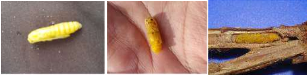
شکل ۵: شفیره آفت سوسک شاخک بلند

شفیبه: شفیره به طول ۳-۲/۵ سانتی متر و رنگ آن در هفته اول زرد بوده و بعد لکه های سیاهی روی آن ظاهر می شود و به رنگ سیاه یا قهوه ای مات تبدیل می شود (شکل ۵).