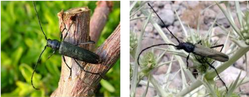
شکل ۶: حشره کامل آفت سوسک شاخک بلند

حشره کامل: سوسک بالغ ماده به رنگ سیاه، سوسک های نر به رنگ قهوه ای مات و بعضی از نمونه ها، رنگ بنفش کم رنگ دارند. حشره کامل به طول ۳/۵-۲/۵ سانتی متر دارای شاخک های بلندی است که از انتهای بدن می گذرد (شکل ۶).