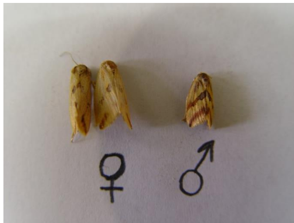
شکل ۲. تصویر راست حشره نر و تصویر چپ حشره ماده است.