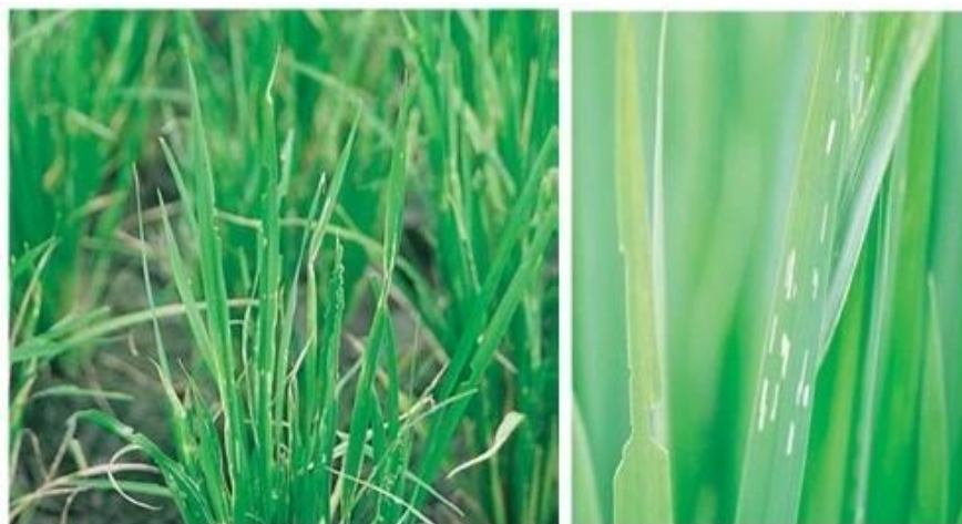
شکل ۵. نحوه خسارت کرم سبز برگ خوار برنج