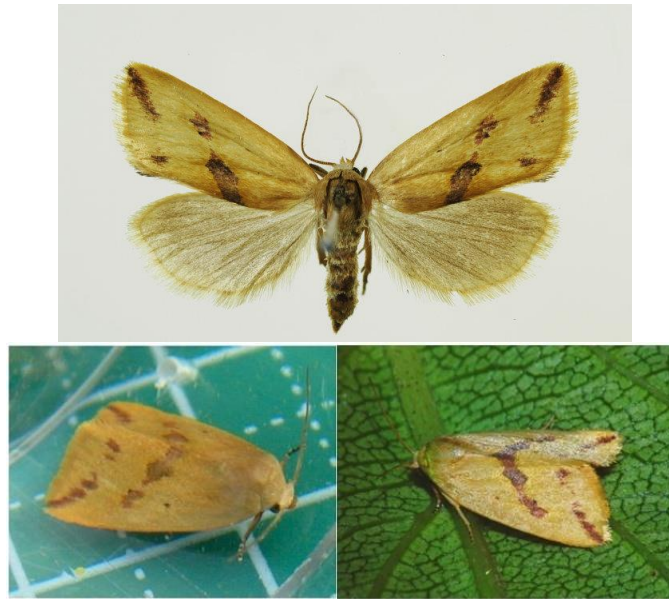
شکل ۱. شب پره‌های برگ‌خوار سبز برنج Naranga aenescen Moore