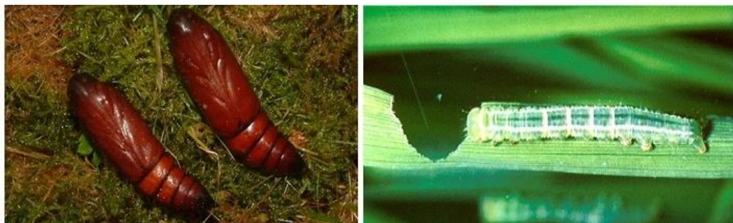
شکل ۴. تصویر شفیره و لارو برگ خوار سبز برنج