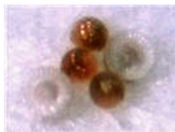
شکل ۲- تخم (تصویر سمت راست) حشره کامل (تصویر سمت چپ)