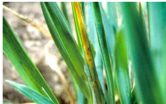
شکل ۳- علائم خسارت کنه قهوه ای گندم