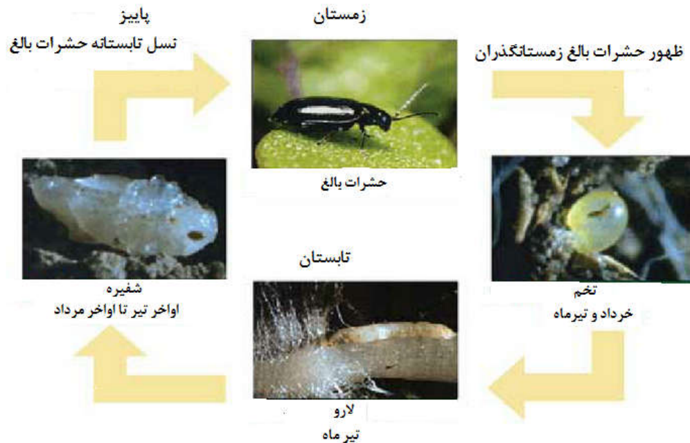
شکل ۲- چرخه زیستی کک چلیپانیان

۲). با رسیدن فصل سرما و رشد گیاهان میزبان، معمولاً تغذیه به حداقل می رسد و در اواخر پاییز بسته به شرایط آب و هوایی مناطق مختلف، سوسک ها به مناطق زمستان گذران پناه می برند (Maurya, 1998؛ کیهانیان، ۱۳۸۷ و Lamb, 1989& 1984).