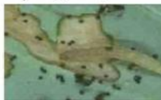
17- لارو بید کلم